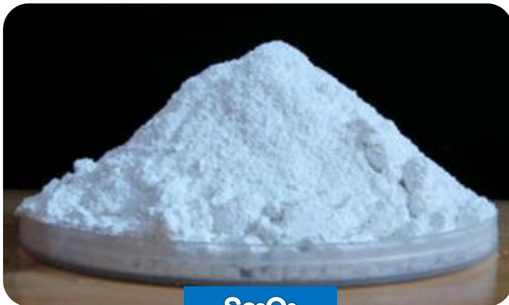
Sc 2 O 3